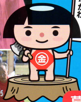
大会マスコット かながわキンタロウ