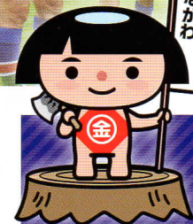
大会マスコット:かながわキンタロウ